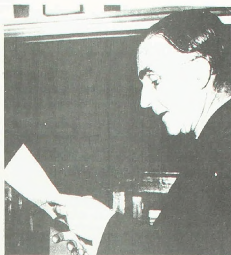
Luis Felipe Vivanco