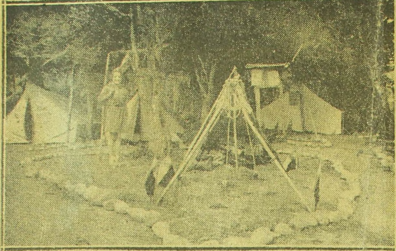
★ En "Villa Julita". Sonriente y confiada una pequeña girl monta guardia en su campamento. En posición ¡firme! parece que está presta a decir Siempre Lista.