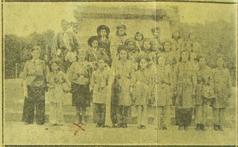
★ Al pie del monumento a Hernando de Magalhaes esperan la voz de ¡march! para dirigirse a Agua Fresca. Fue en 1943. Muchas de las que aquí posan son hoy día buenas dueñas de casa y madres de numerosa familia.